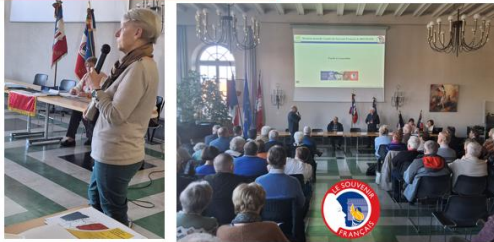
Réunion en salle des fêtes de l'Hôtel de Ville de BRUMATH

Devant un parterre d'environ 90 personnes notre comité a présenté comme chaque année le rapport moral d'activités et le rapport financier. L'année 2025 a été très riche en actions, voir le bilan dans notre bulletin d'informations n°4/2025 et le nombre de nos adhérents est sur une pente ascendante très encourageante (179 en fin d'année). Merci à tous nos fidèles soutiens.