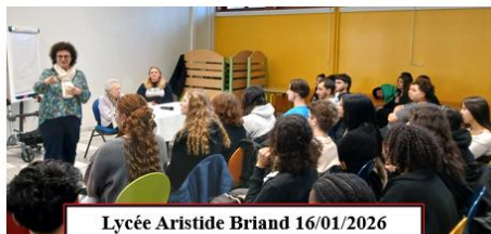
Lycée Aristide Briand 16/01/2026

16/01/2026 : Simone Polak, rescapée d'Auschwitz, rencontre les élèves du Lycée Aristide Briand de Schiltigheim