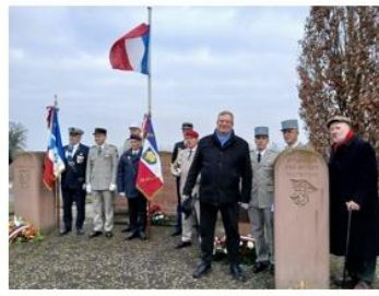
Bataille de Kilstett – janvier 1945