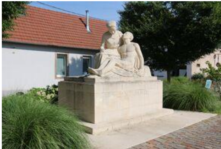
Monument aux morts de Brumath