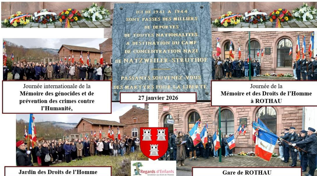
Journée internationale de la Mémoire des génocides et de prévention des crimes contre l'Humanité,