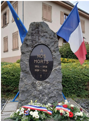
Monument aux morts Eckwersheim

Exemples de monuments aux morts « muets » de notre périmètre :