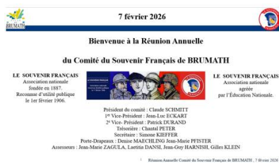
07/02/2026 Réunion annuelle du Comité de Brumath