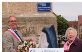
Commune de Gevingey