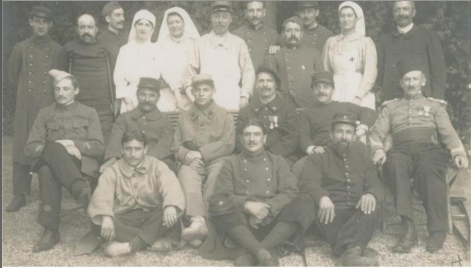
Le corps des infirmières temporaires créé en 1916